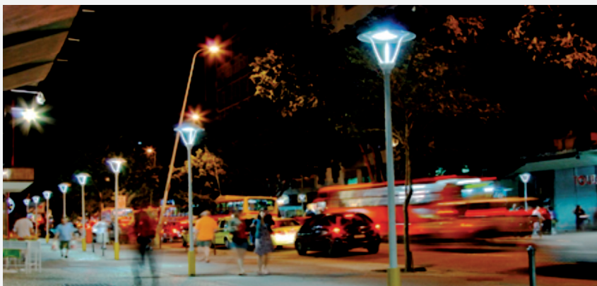
Iluminação ornamental da Praça Nossa Senhora da Paz em Ipanema

No Estado do Rio de Janeiro, a URBELUZ Energética, que integra o Grupo CONASA no segmento de sistemas de iluminação, realizou e implantou vários projetos de expansão e efficientização de sistemas de iluminação pública e ornamental. Os destaques vão para o projeto RioLuz que incluiu 4 mil pontos da iluminação pública da Avenida Brasil, 250 pontos de iluminação ornamental da Praça Nossa Senhora da Paz em Ipanema e do calçadão da Rua Visconde de Pirajá, e mais 5 mil pontos de outros projetos de efficientização e expansão; para o município de São João do Meriti com 19 mil pontos para a gestão de todo o parque de iluminação da cidade mais a implantação de iluminação ornamental em passarelas e na Igreja Matriz da cidade; para a Rodovia Presidente Dutra com a expansão de 512 pontos de iluminação mais a ornamentação com tecnologia LED em 57 torres de transmissão de energia; e para o município de Rio das Ostras com a manutenção do parque de iluminação pública em 18 mil pontos. Confira nas fotos: