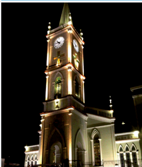
Iluminação ornamental na Igreja Matriz de São João do Meriti