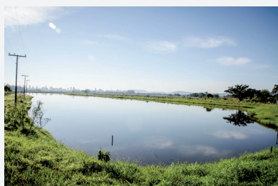
Lagoa de reservação de água bruta

O abastecimento de água tratada em Itapema alcança 100% da população. Os investimentos realizados pela Conasa Águas de Itapema e a gestão inteligente do recurso garante à cidade abastecimento durante todo ao ano, incluindo épocas em que o município recebe grande quantidade de turistas, com população flutuante 10 vezes superior ao número de moradores.