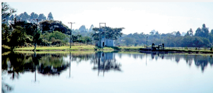
Lagoa de reservação de água bruta: capacidade de 290 milhões de litros de água

Tanto o sistema de coleta e tratamento de esgoto quanto de tratamento e abastecimento de água receberam vários investimentos durante o ano de 2017. Implantação de reservatórios, melhorias operacionais, reformas de infraestrutura, substituição de equipamentos, operação de novas instalações, implantação de geradores, entre outras ações fortalecem os sistemas para a próxima temporada de verão. A Companhia dispõe ainda de plantão 24 horas por dia, atendendo pelos fones (47) 3268-8200 ou pelo 115.