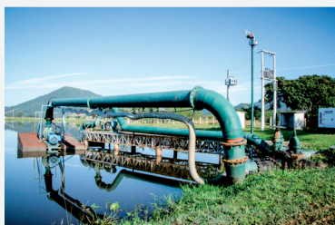
Lagoa de reservação de água bruta

Até 2004, a capacidade de reservação de água bruta do sistema de abastecimento em Itapema era de aproximadamente 350m 3 . A CONASA - Águas de Itapema ampliou a capacidade de armazenamento para 290 milhões de litros com a implantação de duas lagoas de acumulação de água bruta.